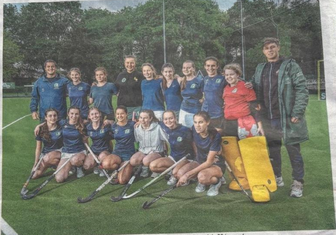
De gemiddelde leeftijd van de eerste damesploeg van Rapid Hockey Temse schommelt rond de 20 jaar oud.

Wat deze meisjes missen in ervaring en bonkigheid, maakten Kaat en co goed in grinta. Ze kennen elkaar van jongs af aan, soms