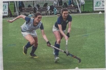
Woensdagavond werd er stevig getraind.

Aan hype is er geen gebrek. "Op de match van zaterdag was de hele U14 aanwezig en zij zeggen ons ook: wij willen later ook bij jullie spelen", zegt Kaat nog. "Onze jeugdwerking krijgt zeker een boost door onze promotie. De toekomst ziet er rooskleurig uit."